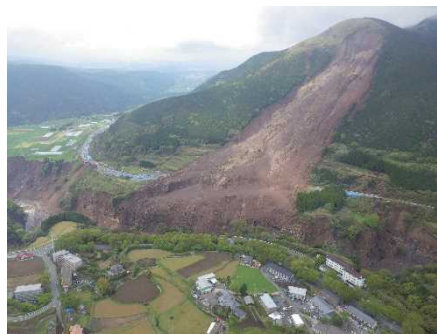
写真 熊本地震時の土砂災害

例えば土石流については、これまで現地調査、監視カメラ、水位計等による現地観測、水理模型実験、数値解析等により流下堆積のメカニズム解明が進み、砂防施設の計画・設計、警戒避難基準雨量の設定、土地利用規制（レッドゾーン）及び警戒避難対象エリア（イエローゾーン）の設定手法等に関する技術指針が策定・改定されてきた。しかし、土石流の発生流下に至るプロセスは降雨流出特性（降雨継続時間等）や土石流ピーク流量を含めまだ解決すべき課題がある。また、谷地形が十分発達していない0次谷の土石流対策施設の計画・設計、巨礫等の衝突に伴う堰堤袖部等の破壊対策（粘り強い構造）、土砂濃度が低い緩勾配区間における効果的な砂防施設の構造等についても、さらに調査研究が必要である。