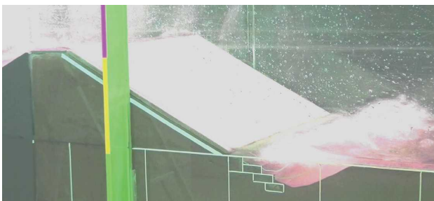
写真 模型実験(ケース⑧ 根留工+段積ブロック)

波浪による海岸堤防の被災原因としては、海側の洗掘があるが、既に堤防裏法先の根固工や消波工等の対策工法が存在する。このため、本研究では、計画規模を超える波浪で生じる越波によって、陸側の地盤が洗掘されることで堤防裏法尻の根固工や裏法被覆工が被災する事象に焦点をあて、写真に示す不規則水路による縮尺1/30の模型実験を実施した。