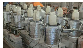
写真 水処理プロセスのベンチスケールリアクター

N_2O 排出量の増加につながる恐れがある。そこで、嫌気性消化導入が下水処理における温室効果ガス排出量に与える影響について、排出される N_2O 量および消費エネルギー等を物質収支等に基づき試算した。窒素負荷となっている返流水による窒素量増加により、水処理工程で約10% N_2O 排出量が増加したが、汚泥発生量の減少による汚泥処理由来のGHG排出量の低減、および再生エネルギー利用による削減により、返流水による影響を加味しても、全体として、嫌気性消化の導入により約35%削減( CO_2 換算)される試算となった(図)。このことから、返流水の窒素負荷の影響による水処理施設から排出される N_2O 量の増加を加味しても、嫌気性消化の導入により、GHGが削減されることが示唆された。