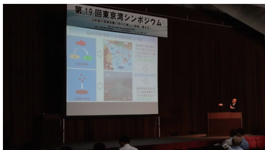
写真 東京湾シンポジウムの開催

このほか、沿岸域の生態系サービスを定量化する手法の開発にも取り組んでいる。従来は、水質や生物等のモニタリングを行って評価することが多いが、我々にとって沿岸域の生態系サービスは、レクリエーション、環境学習、生物多様性の場でもあるなど、実に多種多様である。このため、これら様々なサービスの価値を定量化するとともに、その価値を向上させるためには水域特性等に応じた効率的な対策を導出する手法を試みている。これまで、東京湾の干潟環境を対象に地域の大学や研究機関とも連携してきたところであり、近くその成果をとりまとめるとともに、他の海域等への適用を進めていく予定である。