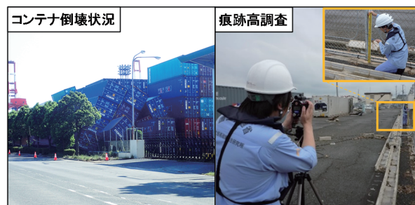
写真 コンテナの倒壊と浸水高調査

先の1821号台風において、神戸港六甲アイランドのコンテナターミナル等が高潮により浸水し、コンテナの航路・泊地への流出や荷役機械や電気系統の被害により港湾の利用が一時的に困難となる事態が発生した。当部では、速やかに研究者らを現地に派遣し、大阪湾各港の被害の状況を調査するとともに、高潮の再現計算結果の提供や各港における対策検討の技術支援を行った。また、風によるコンテナの倒壊対策として、積み方や固縛方法による耐風性能を把握するための実験を行っている。