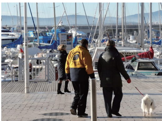
写真 カシワ湾（仏）の水辺空間

ている。今後は、研究会の提言も踏まえ、ガイドラインや事例集の作成等につなげて参りたい。