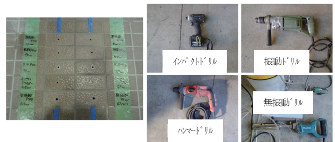
写真2 アンカーピン施工のためのドリル穿孔検討