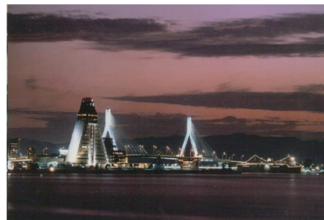
図-2 海上からの景観に配慮した事例（青森港）

今後、クルーズ船、クルーズ来訪客増大が海・港側からみた「みなとまちづくり」を考える切っ掛けになり各地の港町における景観・空間の総点検、資源の再発掘・活性化に繋がればよいと考えている。