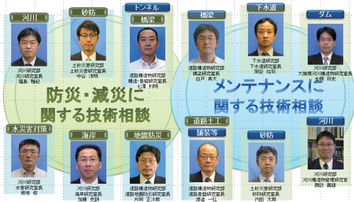
図-1 「国総研技術相談窓口」